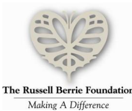
The Russell Berrie Foundation Making A Difference

■ קרן ראסל ברי (The Russell Berrie Foundation)